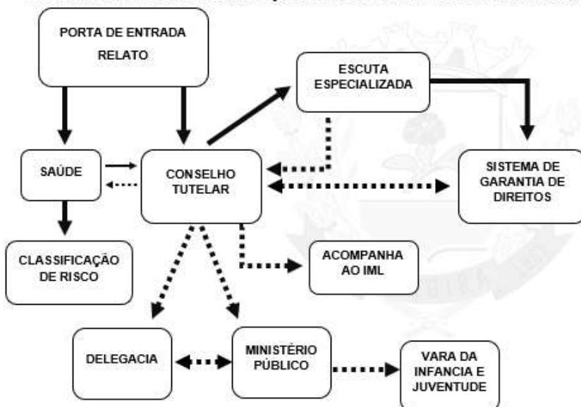
FLUXOGRAMA: ATENDIMENTO À CRIANÇA E AO ADOLESCENTE VITÍMA DE VIOLÊNCIA SEXUAL ATÉ 72 HORAS – ATUALIZADO 2024

Porta de entrada: Saúde, Educação, Conselho Tutelar, Assistência Social e Polícia Militar (deve colher o relato).